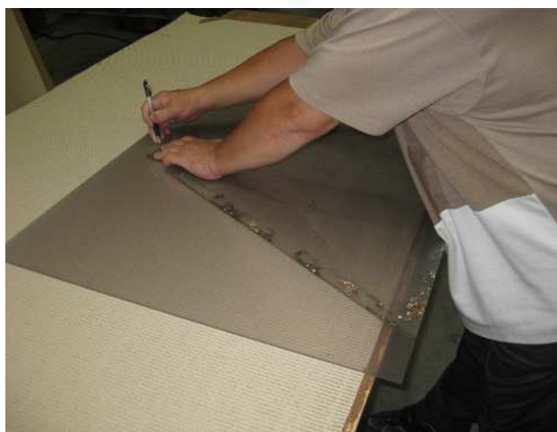
② 回収してきた目隠し板に 合せて形状をケガキ