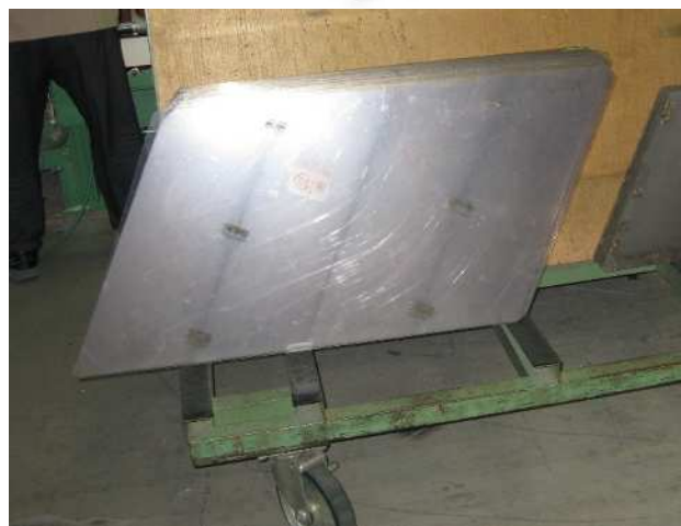
回収してきた目隠し板