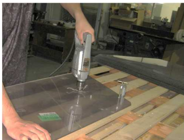
④ U字ボルト取付用の穴あけ