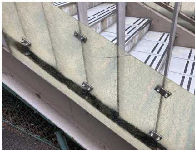
① 既設目隠し板を撤去・回収