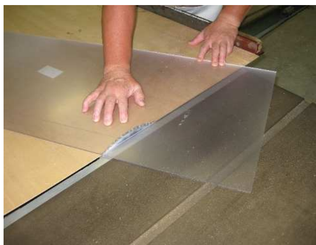
③ ケガキに沿って裁断